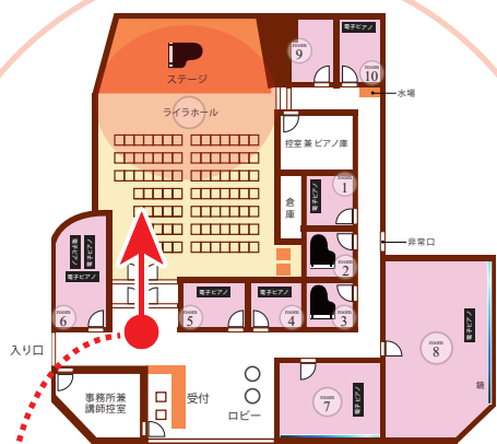
こちらから見たホール内です