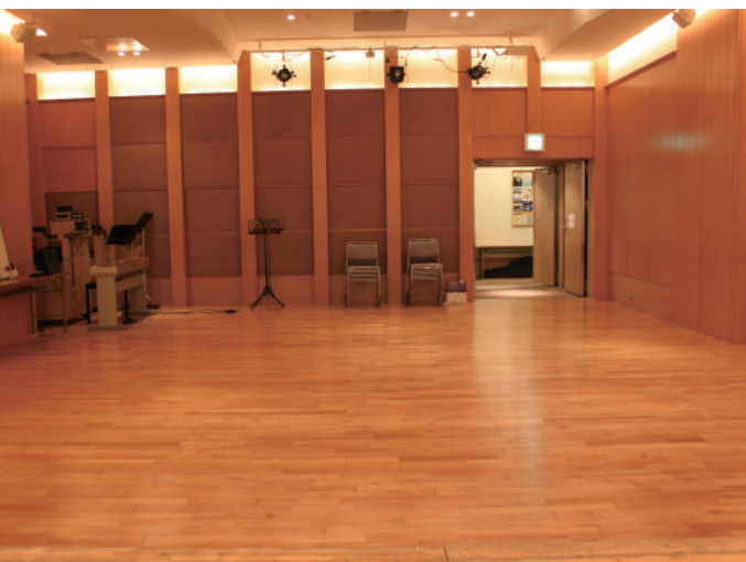
こちらから見たホール内です